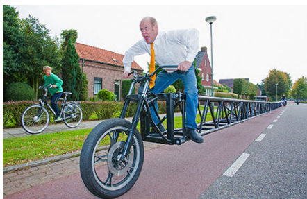
Abb. 142 | Das längste Fahrrad der Welt