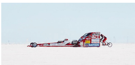
Abb. 143 | Hinter einem Dragster herfahrend stellte die Amerikanerin Denise Mueller-Korenek einen Geschwindigkeitsrekord auf.