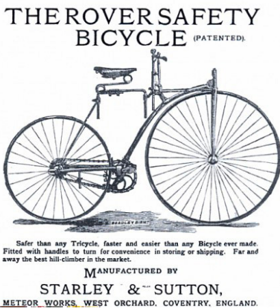
Abb. 140 | Niederrad oder Sicherheitsfahrrad