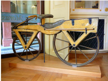
Abb. 138 | Die obige Draisine wurde aus Kirschbaum und Nadelholz angefertigt und befindet sich in einem Museum in Heidelberg.

Das Interesse an der Draisine liess zwei Jahrzehnte nach deren Aufkommen wieder nach, da die Fortbewegung immer noch mühsam, die Produktion aufwendig und die Kosten hoch waren. So verschwanden die Laufräder wieder von der Strasse.