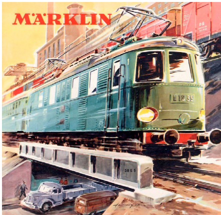
Abb. 188 | Die Firma Märklin setzte früh auf Modelleisenbahnen und konnte sich bis heute erfolgreich durchsetzen.