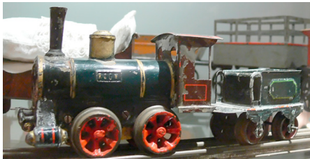
Abb. 186 | Lokomotive von Rock & Graner aus der Zeit um 1900

Erst mit der Währungsreform von 1948 änderte sich die Situation zugunsten der Spielzeughersteller. Die Industrie erholte sich und erreichte Ende der 1950er-Jahre wieder das Vorkriegsniveau.