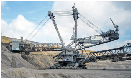
Abb. 189 | Der Schaufelradbagger 288 bei der Arbeit