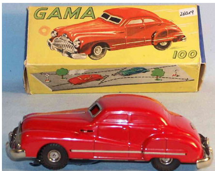
Abb. 187 | Das Spielzeugauto von Gama kam im Jahr 1950 auf den Markt und wurde mit einem Federwerk angetrieben.